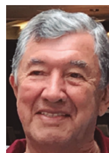
Por: Mayor General José M. Arbeláez Caballero Ejército Nacional

La contienda con Chile, cuantitativamente, no fue tan importante en lo que respecta al detrimento territorial, sino, lo que cualitativamente significó la pérdida de su costa marítima.