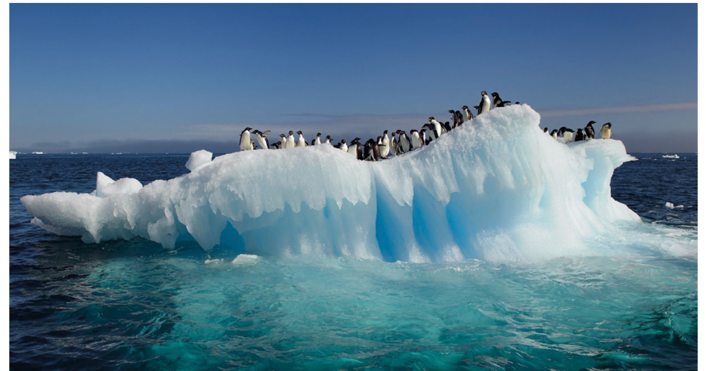
Pinguinos en la Antártida