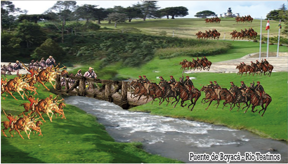
Batalla de Boyacá. Departamento de Diseño CGA.

mártires en el Pantano de Vargas , y en tales condiciones la pureza de las instituciones y la membresía colombiana puedan disfrutar de un futuro promisorio para vivir sin violencia, sin odio, sin pobreza, sin divisiones y en paz.