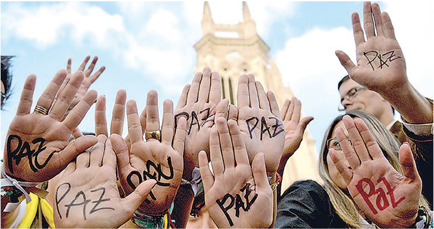
Muestra de apoyo hacia la paz.

Disminución de la impunidad: Por otro lado, en los cincuenta años que llevamos de conflicto, los actores del mismo, han realizado acciones violatorias de los derechos