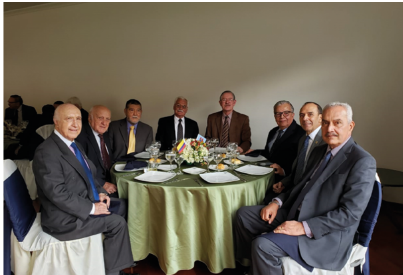
De izquierda a derecha. Brigadier General Valderrama, Mayor General Neira, Mayor General Rodriguez, Brigadier General Bautista, Brigadier General Bedoya, Mayor General Salazar, Mayor General Melo y Mayor General Cabrera