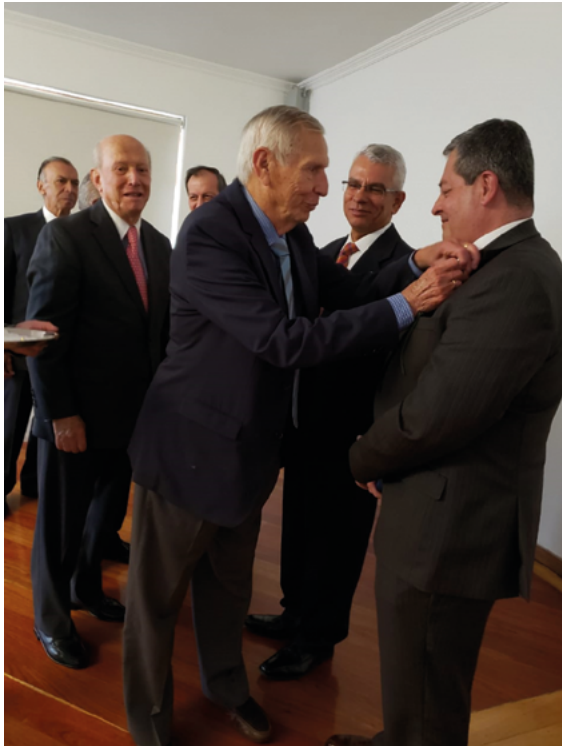
Imposición Escudo Socios CGA

Asamblea General 28 de Marzo del 2019 Club de la FAC