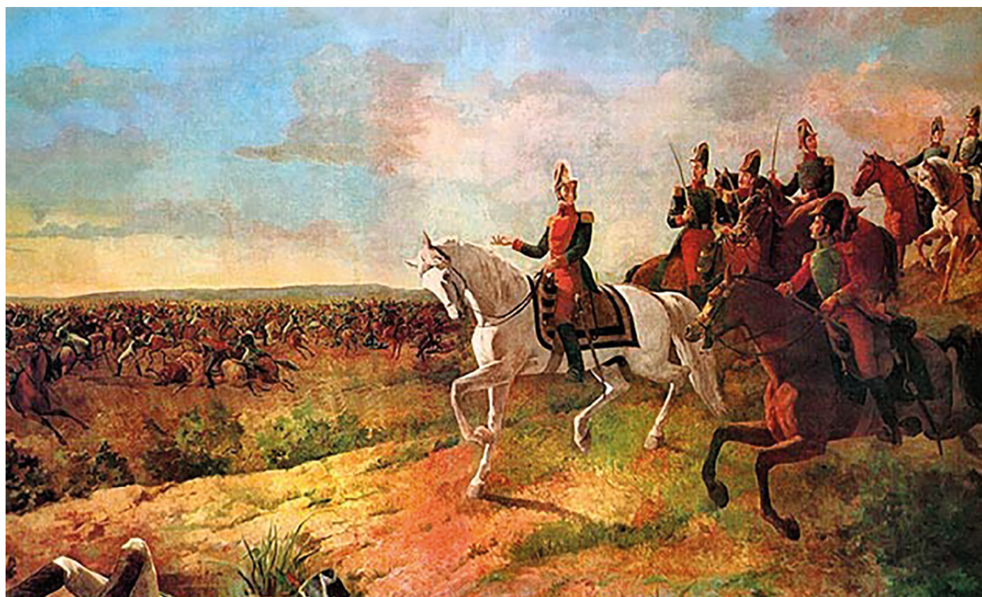
Batalla de Junín. Fue el penúltimo enfrentamiento armado que sostuvieron el ejército patriota comandado por Simón Bolívar.

marina. Las tropas del Perú estaban dispersas en su geografía.