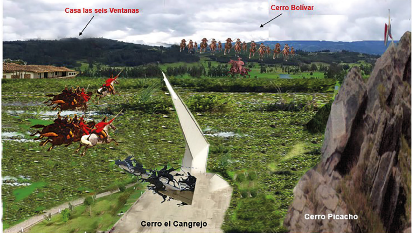
Batalla de Boyacá. Departamento de Diseño CGA.

¿Y cuál el futuro de Colombia ante tanta amenaza Interna y Fuera de Fronteras? Señores Generales y Almirantes. Ustedes que han visto el amanecer y el atardecer de la vida nacional, y participado en diferentes administraciones, se requiere indiscutiblemente de sus conocimientos, experiencias, inteligencia, sentimientos y conciencia patriótica para analizar lo bueno y lo malo y hablar sin temor ante la opinión pública y con grandeza explorar caminos de democracia como lo hicieron nuestros