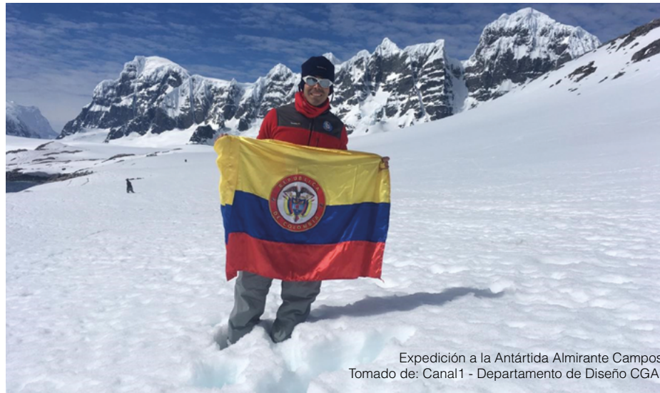
Expedición a la Antártida Almirante Campos

cómo se verán afectados nuestros litorales Pacífico y Caribe, cómo nos cambiará la vida de los campos con nuevas inundaciones o sequías y esto cómo cambiará la morfología de nuestro país en su conjunto. No es un tema menor, es algo a lo que debemos apuntarle con mucha definición.