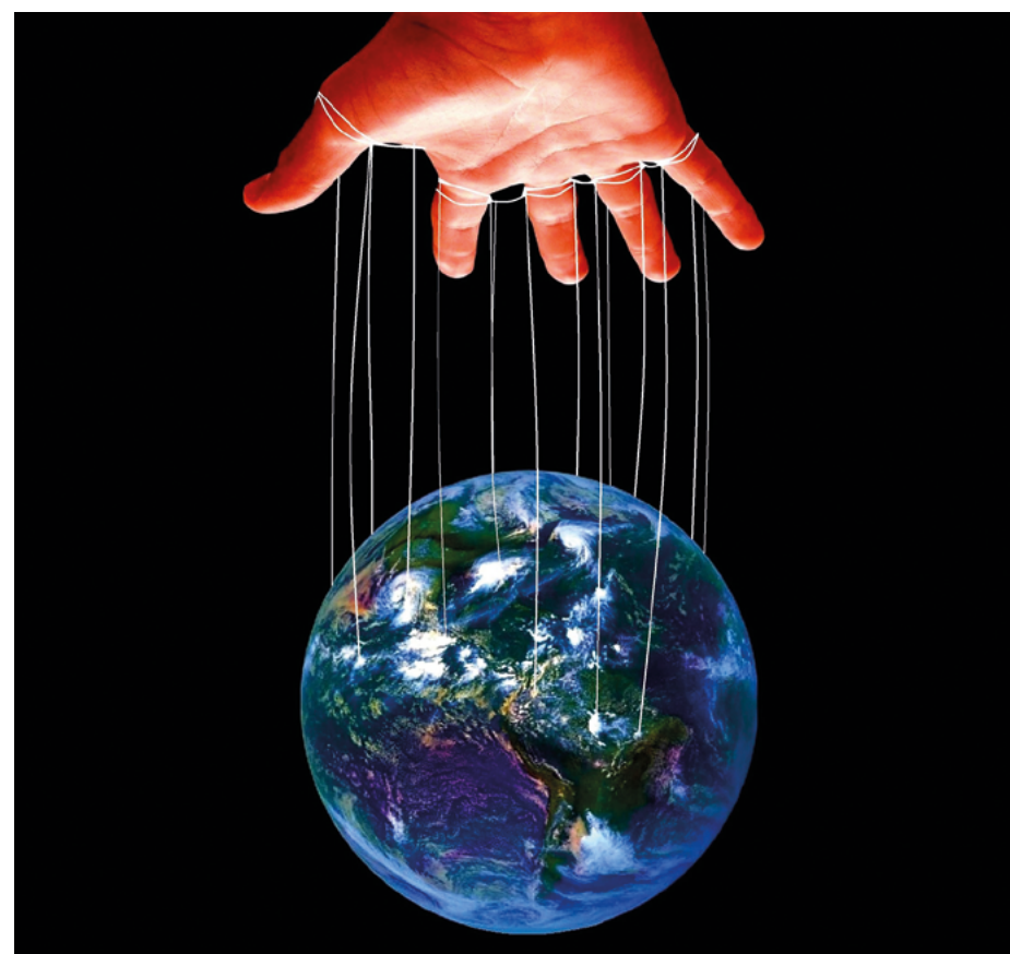
Manipulación Mediática

Pero lo que es peor, ¿con qué derecho este individuo se ha convertido en el fiscal externo de Colombia? Lamentablemente existen algunos nacionales que le rinden pleitesía y lo colocan por encima