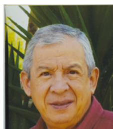
Por: General (RA) Alfonso Amaya Maldonado Ex Comandante Fuerza Aérea Colombiana

Al acercarse el centenario de la Fuerza Aérea se puede afirmar que no siempre tenemos tanta conciencia del merecimiento de esta celebración.