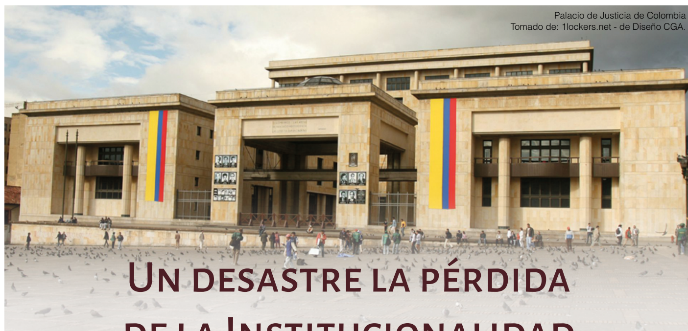
Palacio de Justicia de Colombia Tomado de: 1lockers.net - de Diseño CGA.