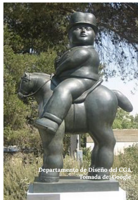
Departamento de Diseño del CGA

Su intervención fue fundamental en innumerables eventos históricos, y ciudades, tierras de cultivo e industrias enteras se adaptaban antaño a sus necesidades. Se esculpían, pintaban y admiraban. Tolstói aseguraba haber acumulado unos nueve años de