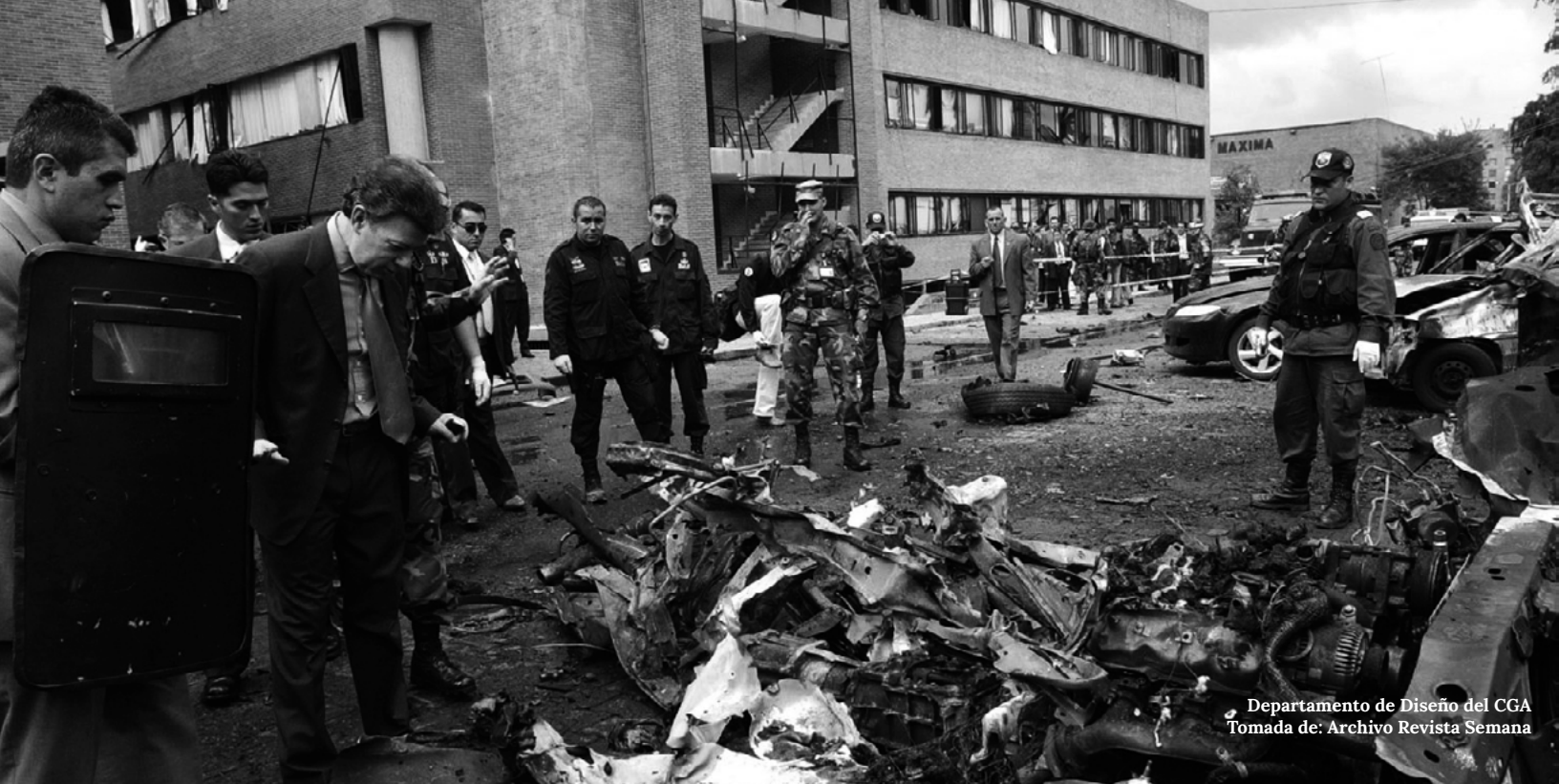
Departamento de Diseño del CGA

ternos, en 1968 se abordó en Teherán la relación del DIH y los derechos humanos. Es así como en los Convenios de Ginebra y en sus Protocolos adicionales se enlistan aquellas violaciones consideradas como especialmente graves, llamadas también crímenes de guerra, cuya finalidad es la de proteger a los civiles de las atrocidades de una de las partes del conflicto.